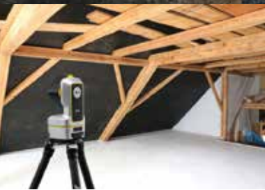
Reichweite bis 250 m